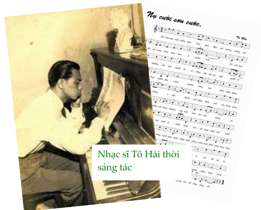
Nhạc sĩ Tô Hải thời sáng tác