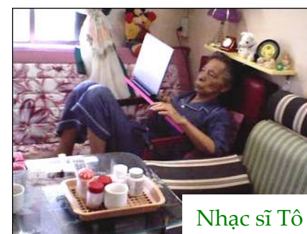
Nhạc sĩ Tô Hải 82 tuổi vẫn miệt mài viết blog